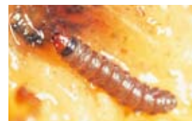
カキノヘタムシガ