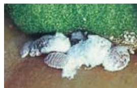
フジコナカイガラムシ