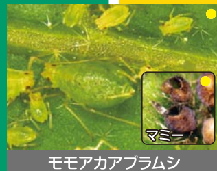
モモアカアブラムシ