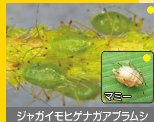
ジャガイモヒゲナガアブラムシ