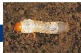
コガネムシ類幼虫