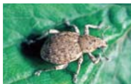
ヒョウタンゾウムシ類