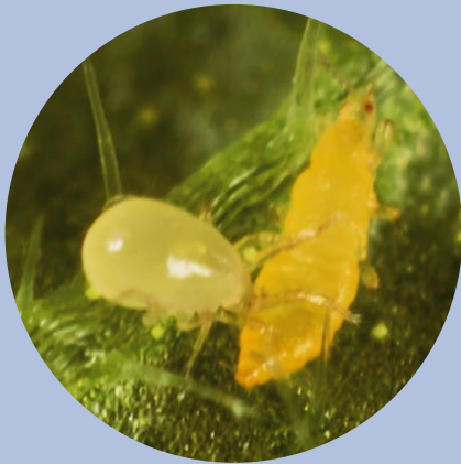
アザミウマ幼虫を捕食する リモニカスカブリダニ