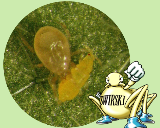
アザミウマ幼虫を捕食する スワルスキーカブリダニ