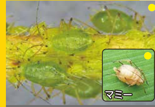
ジャガイモヒゲナガアブラムシ