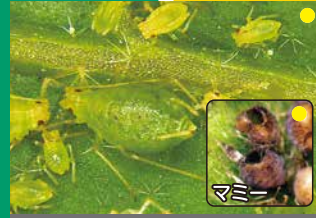
モモアカアブラムシ