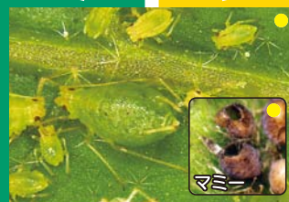
モモアカアブラムシ