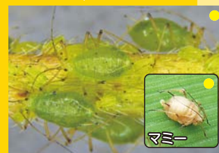
ジャガイモヒゲナガアブラムシ