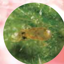
ミヤコカブリダニ